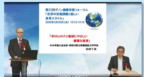
※昨年度のライブ配信の様子